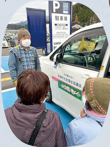
買い物ボランティア (みそみ買い物メイト)