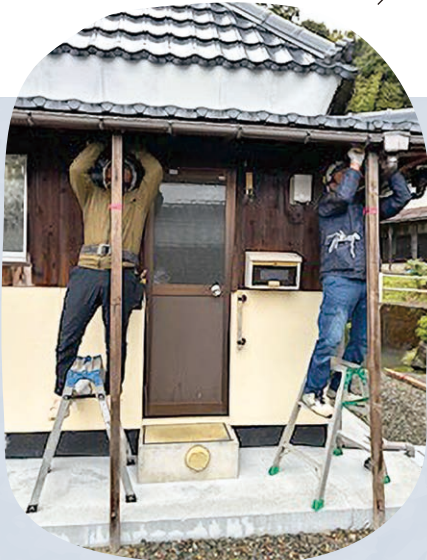
上中建築組合ボランティア (家屋補修)