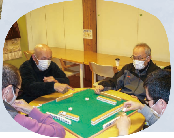
麻雀ボランティア (五湖の郷)