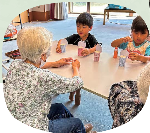
福祉交流会 (みそみ保育所)