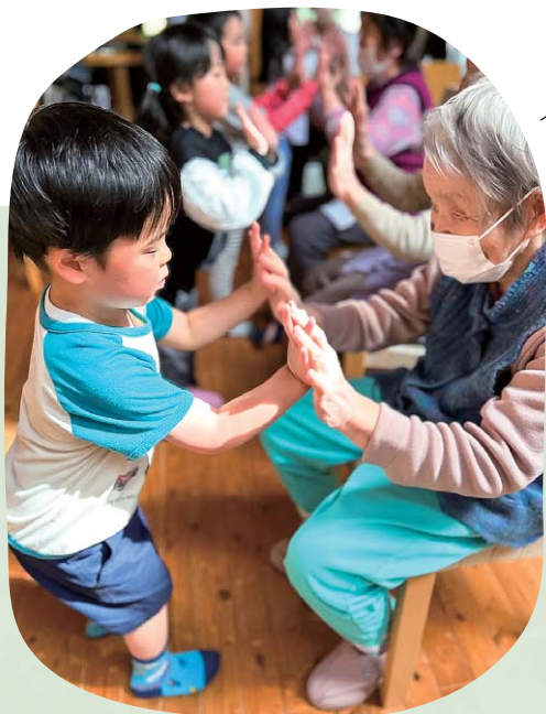
福祉交流会 (梅の里保育園)