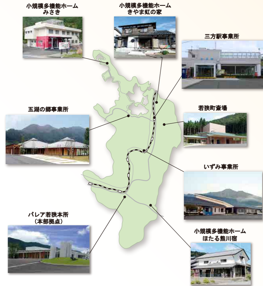
若狭町社協事業所マップ