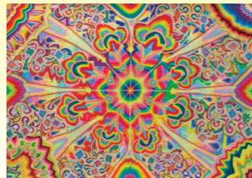
一般の部 福井県知事賞